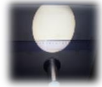
Projekcija temnih peg

Kaj je Sonce? Kako se imenujejo temne pege na površju Sonca in kako velike so v primerjavi z Zemljo? Kako nastaneta Sončev in Lunin mrk?