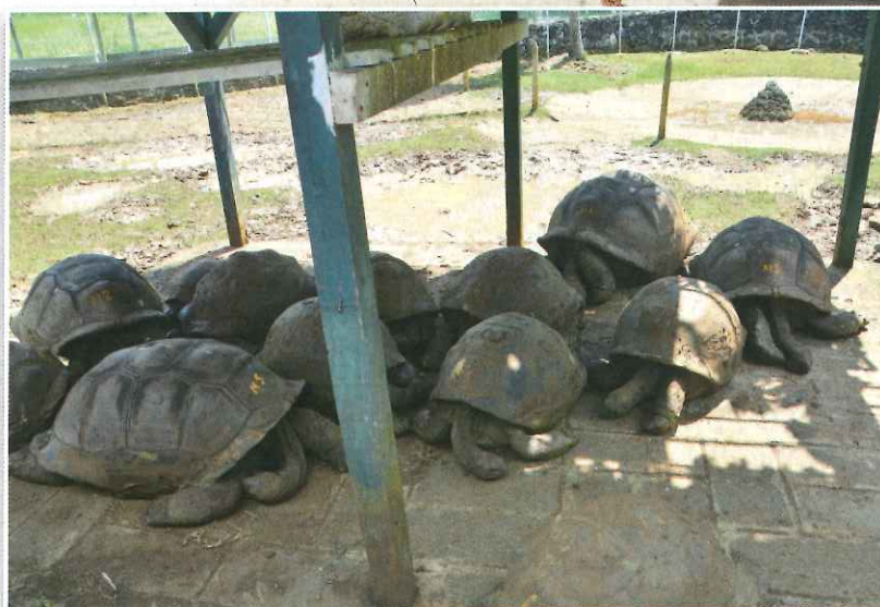
Aldabska orjaška želva v vzgajališču na Mavriciju