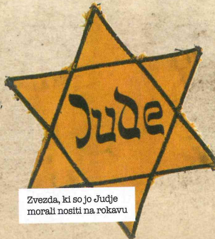
Zvezda, ki so jo Judje morali nositi na rokavu

Frankovi so se preselili, ker so bile razmere za Jude v Nemčiji nevzdržne. Sprejeti so bili posebni zakoni, ki so močno omejevali njihove pravice. Družina Frank je upala, da bo na Nizozemskem bolje. Toda - izbruhnila je druga svetovna vojna in ena prvih držav, ki so jih nacisti napadli, je bila -