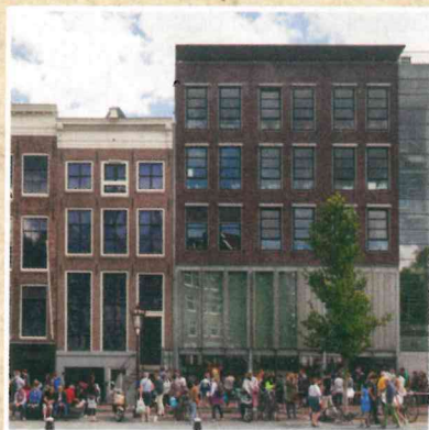
Hiša, v kateri se je skrivala družina Frank v Amsterdamu, je danes muzej.

Edini, ki je vojno preživel, je bil oče Otto. Vrnil se je v Amsterdam, našel hčerin dnevnik in ga objavil v njen spomin. Tako je junija 1947 prvič izšel Dnevnik Ane Frank , ki je postal velika uspešnica in ena najbolj znanih knjig na svetu. Prevedli so ga v približno sedemdeset jezikov, po njem so prirejali gledališke, televizijske in filmske predstave. Leta 1960 je bilo skrivališče preurejeno v muzej z imenom Hiša Ane Frank . Anin oče je do svoje smrti sodeloval z muzejem. Njegova glavna želja – da ljudje z branjem knjige spoznajo nevarnosti, ki jih prinašajo diskriminacija, rasizem in sovraštvo – se uresničila v celoti.