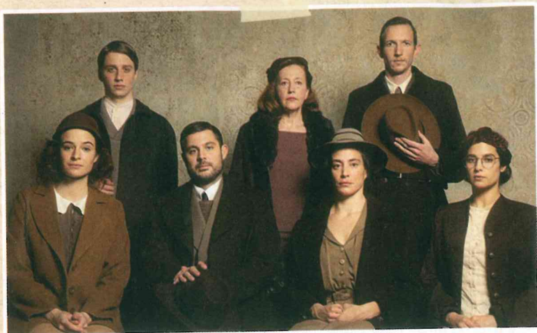
Po knjigi Dnevnik Ane Frank je bilo že veliko uprizoritev. Na fotografiji je uprizoritev v ljubljanskem Mini teatru iz lanskega leta.

hiše, spredaj so bili poslovni prostori očetovega nekdanjega podjetja za predelovanje sadja. Nenehno so morali paziti, da šepetajo, ne kihajo, hodijo tiho in se ne izdajo. Zato je bil dnevnik Ani največja opora. Na prvo stran je zapisala: »Oh, kako sem vesela, da sem te vzela s seboj!« Dnevnik je napisan v obliki pisem namišljeni prijateljici Kitty. Vsebuje smešne in žalostne stvari. Piše o vsem – o nizozemskem vsakdanjem življenju, dogodkih, povezanih z vojno, odnosih med ljudmi v skrivališču in o svojem odrasčanju. Tako si lajša osamljenost in utesnjenost. Spoznava, da se v prisiljeni zaprtosti , v kateri se z družino znajdejo, slišijo žaljive besede in nestrpnost. Piše o tem, kako v teh zahtevnih okoliščinah dojema svoje telo, mladostništvo, potrebo po nežnosti, prijateljstvu. Opisuje zahtevne odnose z mamo – v največjo oporo ji je oče. In ja, piše tudi o ljubezni. Teško ji je – navajena je na drugačno življenje. Vendar – čuti varnost in zaradi tega je hvaležna. Svoje življenje zdaj razume kot priložnost za spoznavanje realnosti: »Ano, šolariko prejšnjega časa, zdaj vidim kot očarljivo, a zelo površno dekle, ki nima nič več skupnega z mano ...« Ko postane bolj resna, se začne zavedati želje po lepoti in dobroti. Razmere jo oblikujejo v odgovorno osebo. Večino svojega časa v skrivališču namenja svojemu dnevniku – branju, pisanju in urejanju zapisov v njem. Želi postati novinarka, uživa v pisanju: »Če se bo izkazalo, da nimam talenta za pisanje