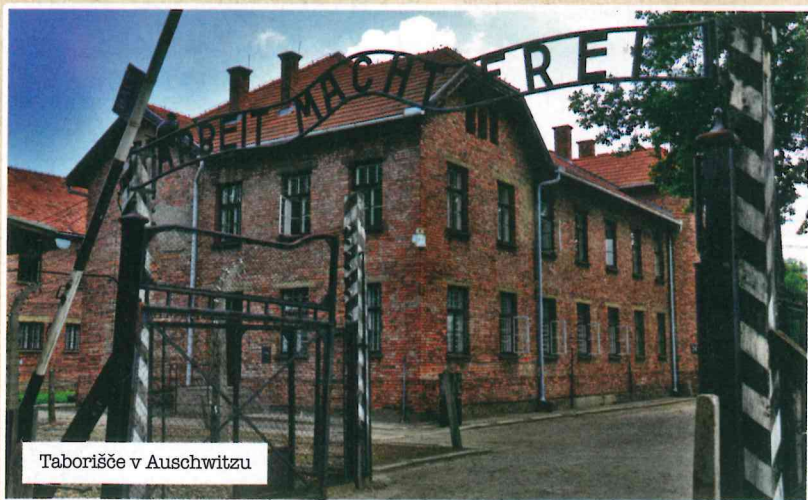
Taborišče v Auschwitzu